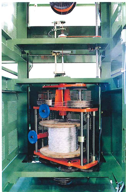
撚り口部およびテープガイド部