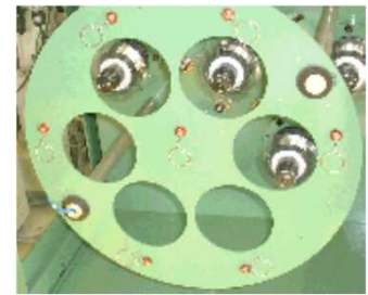
Lay plate assembly